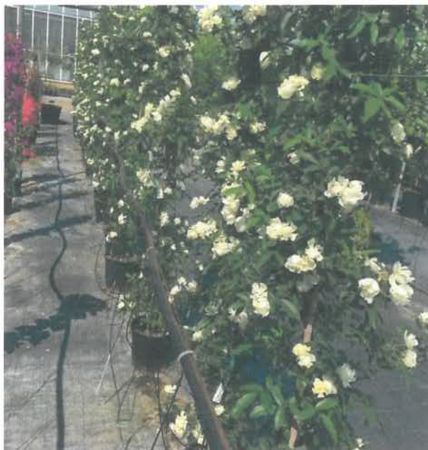
Foto materiale offerto

Descrizione e caratteristiche del materiale offerto