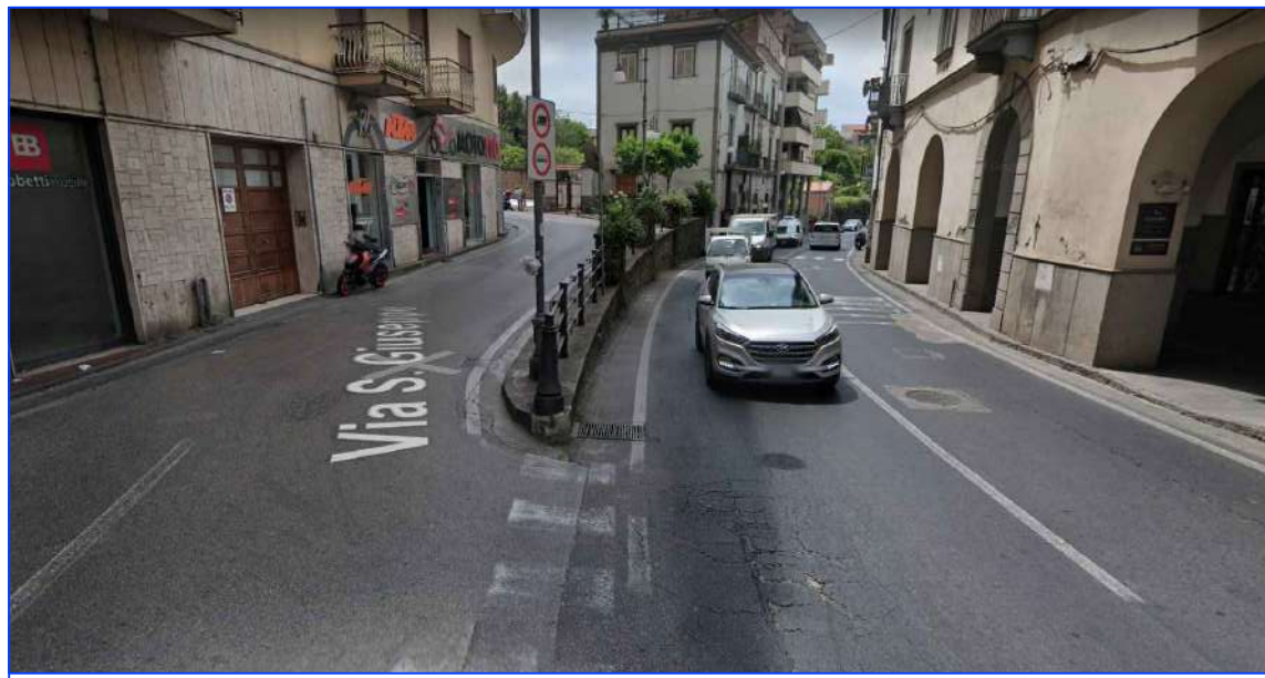
CONO OTTICO 1 Inizio Tratto Stradale di Via San Giuseppe da incrocio con Corso Italia